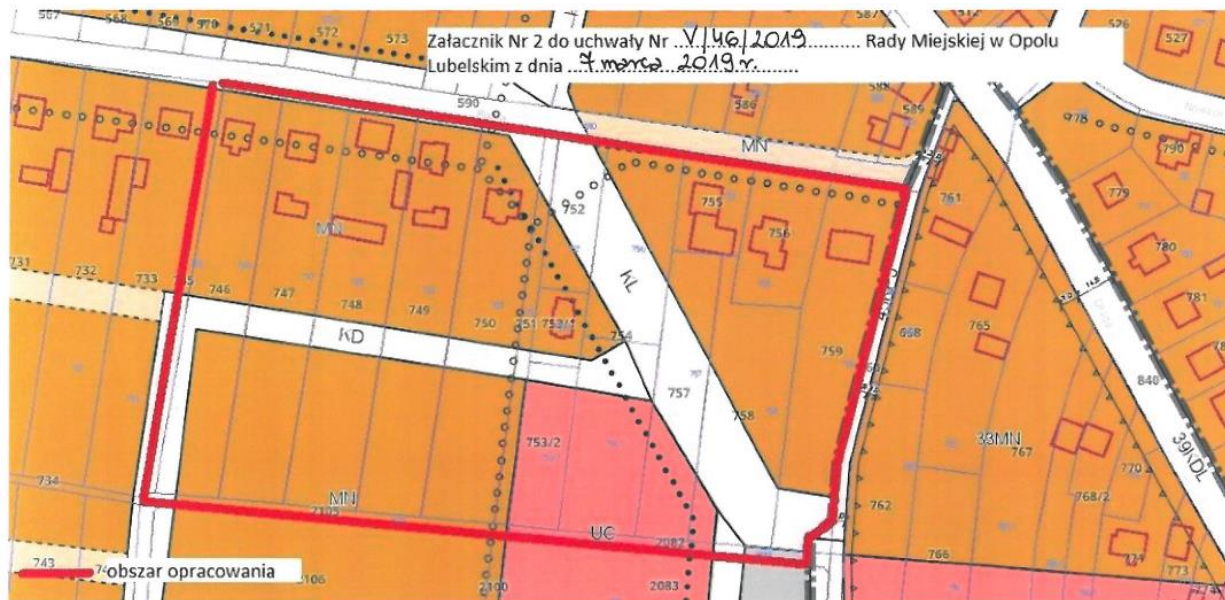
Ryc. 2 Obszar objęty mpzp w rejonie ul. Polnej (Załącznik 2)