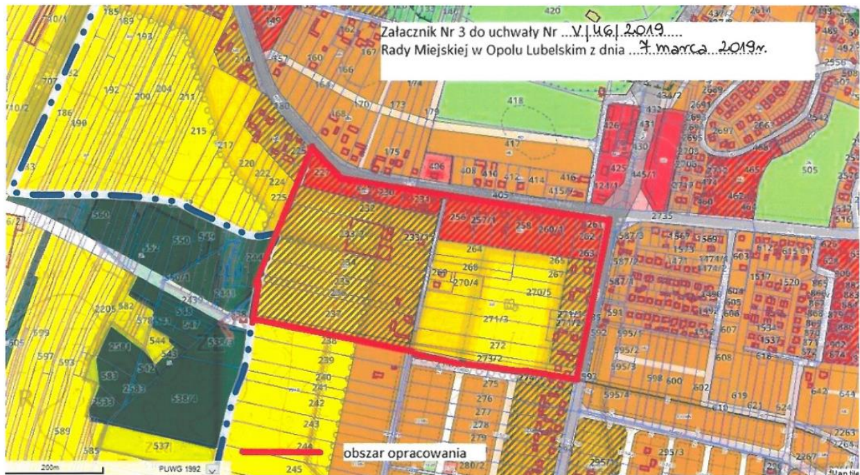
Ryc. 3 Obszar objęty mpzp w rejonie ulic Kaliszańskiej i Południowej (Zař. 3)