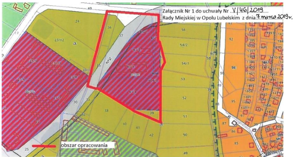
Ryc. 1 Obszar objęty sporządzeniem mpzp w rejonie ul. Podzamcze (Załącznik 1)