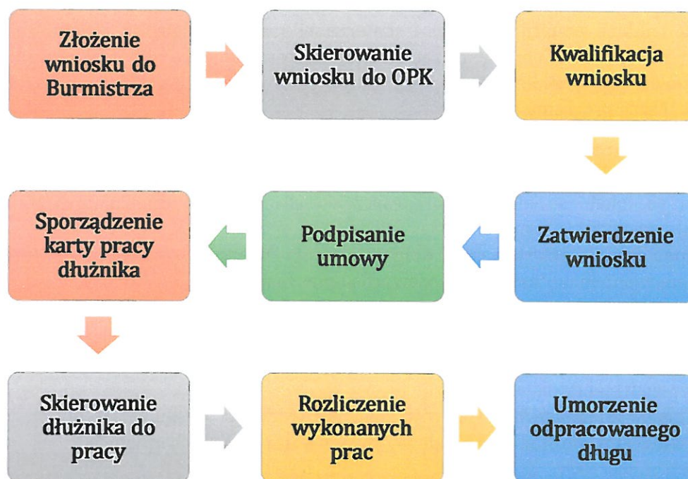
Rysunek 1. Procedura postępowania w ramach programu oddłużeniowego w Gminie Opole Lubelskie