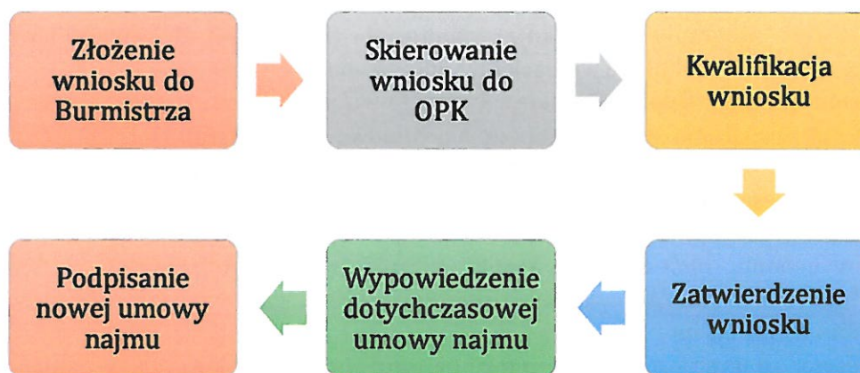
Rysunek 2. Procedura postępowania w ramach programu zamiany mieszkań w Gminie Opole Lubelskie

Uczestnictwo w programie jest dobrowolne i odbywa się na wniosek zainteresowanego najemcy. Operatorem programu będzie Opolskie Przedsiębiorstwo Komunalne Sp. z o.o. Procedura postępowania w ramach programu została przedstawiona schematycznie poniżej.